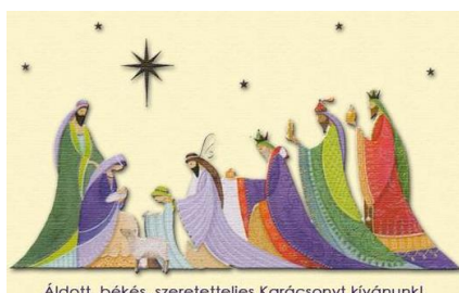
Áldott, békés, szeretetteljes Karácsonyt kívánunk!

Vasárnap finom ebédet ettünk. Kaptunk egy nagy tányér borsot hurkával. Nekem a verés jobban ízlett, mint a májas. Kertem hozzá kerék fehér cipőt is. Mindenki megőrült, amikor nagymama behozta a hajas süteményt.”